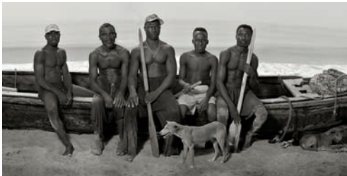
#1 Men on Pirogue, Djotin Plage, Ouidah, Benin, 2011

a) ca. 61×115 cm (Blatt), ca. 51×83 cm (Motiv), Auflage: 25 Exemplare, je Blatt 4.900 Euro b) 107×203 cm (Blatt), ca. 90×146 cm (Motiv), Auflage: 10 Exemplare, je Blatt 7.900 Euro