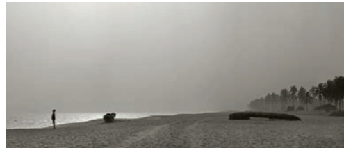
#2 Plage Ouidah, Benin, 2011