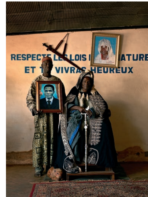
#9 King of Ouassa Pèhunco and Sariki Zongo, Salone d'Accueil, Pèhunco, Benin, 2011